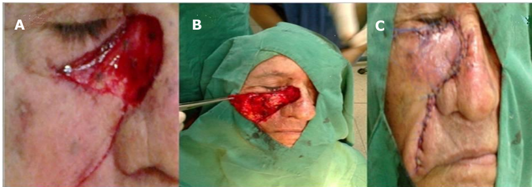
Fig. 2. Colgajo de avance nasogeniano en el lado derecho: A) confección, B) reposición y C) cierre