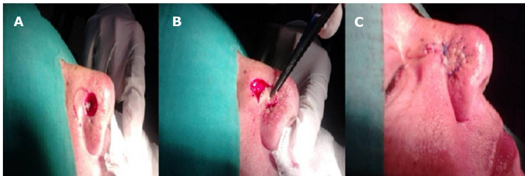
Fig. 3. Colgajo de rotación nasogeniano en el lado derecho: A) confección, B) reposición y C) cierre

En este caso específico el colgajo solo se rota para cerrar el defecto quirúrgico sin necesidad de avanzarlo. Se muestra su realización en una paciente con un CB en la región nasal derecha; primero se extirpó la lesión, luego se confecciona el colgajo y después se reposicionó este (figura 3).