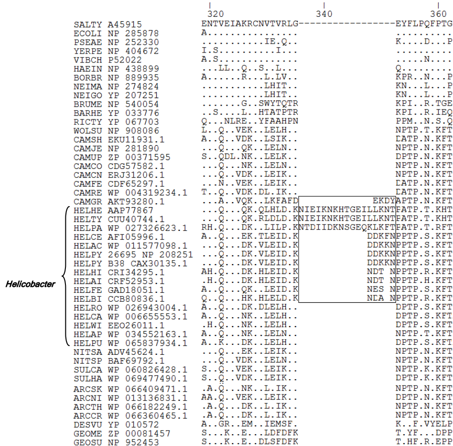
Fig. 3. Alineamiento de la subunidad alfa de la enzima ADN polimerasa III