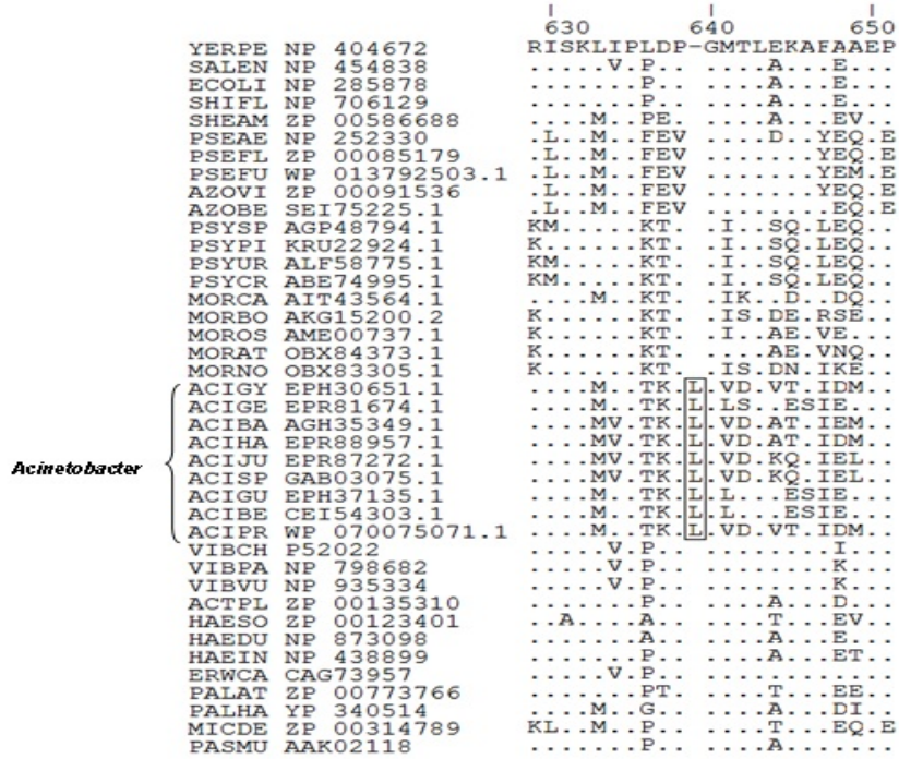
Fig. 2. Alineamiento de la subunidad alfa de la enzima ADN polimerasa III