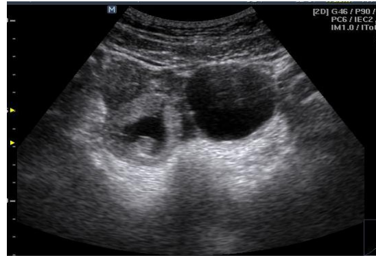
Fig. 2. Saco gestacional con embrión e imagen quística a la izquierda correspondiente al cuerpo amarillo del embarazo