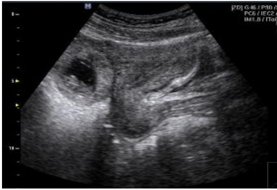
Fig. 1. Saco gestacional en el anejo derecho con embrión vivo en su interior