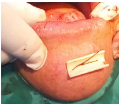
Fig. 2. Colocación del fragmento de sonda por fuera del labio