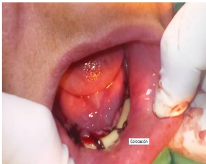
Fig. 1. Colocación de la sonda