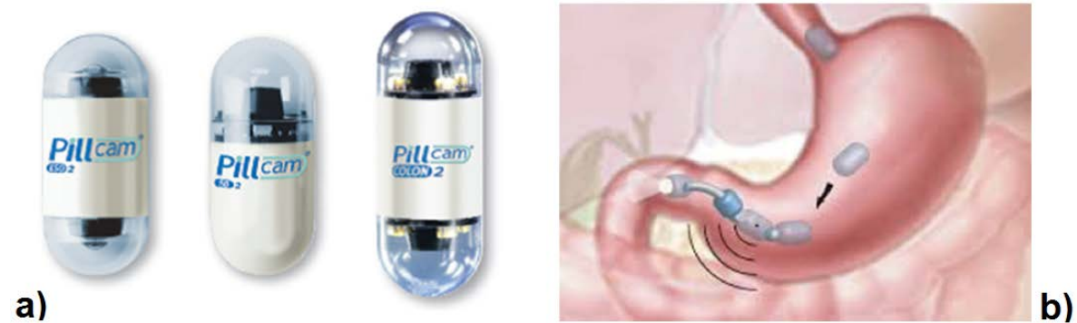
Fig 2 a). Cápsula endoscópica Pillcam

Asimismo, en la figura 2b se muestra otro tipo de minirobot que se puede utilizar en cirugía conocido como del tipo modular. Está compuesto por módulos que se ensamblan dentro del cuerpo humano y forman minirobots funcionales. 24 Este robot modular ingerible está formado por varios minirobots del tipo cápsula híbrida, los cuales son ingeridos por el paciente y a través de magnetos se conectan en el interior del cuerpo; estos magnetos permiten su manipulación externa.