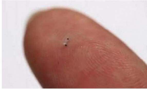
Fig 3. Nanorobot que puede nadar dentro de la retina. (Tomado de chaparro y Vivas) 24

propulsión o en dependencia de su composición y manipulación de la temperatura para estimular su movimiento. 27 Esto permite que unido al diseño y construcción de estos pequeños dispositivos, además de la ingeniería y la medicina, estén la química y la biología, lo cual amplía el carácter multidisciplinario de la robótica aplicada al sector de la salud. 24