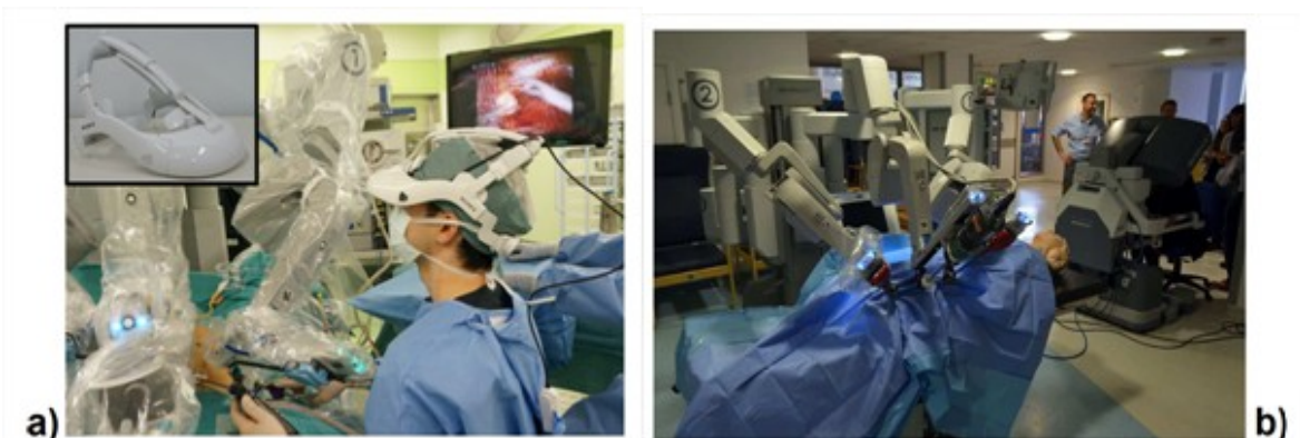
Fig 4 a). Imagen de la consola HMD empleada en una intervención laparoscópica asistida por robot (tomado de Yoshida et al ) 28

No podría hablarse de aplicación de la mecatrónica en la medicina sin mencionar el Sistema quirúrgico Da Vinci (figura 4a). Su primera versión surgió en 1999 y es el robot quirúrgico más avanzado conocido hasta la actualidad, pues realiza procedimientos de cirugía abdominal por vía laparoscópica donde el cirujano puede observar las imágenes en la pantalla de un monitor. Para mejorar este sistema Yoshida et al 28 desarrollaron un novedoso dispositivo (figura 4b) para la observación de la imagen, ubicado en la propia cabeza del cirujano. Este sistema ubica una imagen 3D de mayor calidad y definición frente a los ojos del cirujano que permite además, mejorar la postura de este.