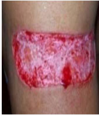
Fig. 1. Zona cruenta luego de la exéresis quirúrgica, antes del tratamiento con Heberprot-P®

Primeramente se hizo un lavado amplio con solución salina fisiológica al 0,9 % y luego se efectuó la primera aplicación intralesional y perilesional del Heberprot-P®, una vez diluido en 5 mL de agua destilada. Las agujas se introdujeron a una profundidad de 0,1 cm y se infiltró entre 0,5-1 mL en cada sitio de inyección. Las aplicaciones posteriores se realizaron en días alternos por consulta externa. No hubo evidencia de infección local y el paciente no requirió hospitalización.