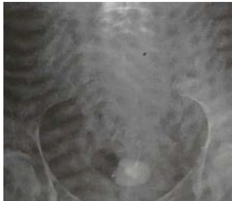
Fig. 1. Litiasis en la vejiga