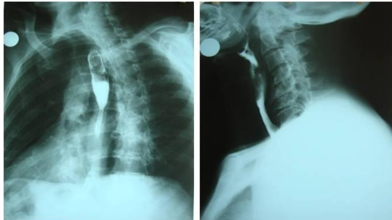
Fig. 2. Esofagograma donde se visualiza compresión extrínseca del tercio distal del esófago por osteofitos desde C4-C7.

El paciente recibió una atención multidisciplinaria y se discutió el caso en conjunto con especialistas en Otorrinolaringología, Gastroenterología, Ortopedia y