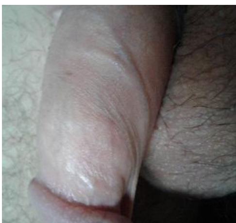
Fig. 1. Vena dorsal del pene engrosada

Se describe el caso clínico de un paciente de 21 años de edad con antecedente de herniorrafia inguinal derecha, quien a las 3 semanas de la cirugía asistió a consulta de control y refirió, que presentaba una induración y dolor intermitente en la región dorsal del pene con 4 días de evolución, la cual había comenzado 48 horas después de una relación sexual prolongada donde consumió marihuana. El dolor se incrementaba con la erección. En el examen físico de los genitales externos se observó la vena dorsal del pene engrosada, dura y dolorosa a la palpación (fig. 1).