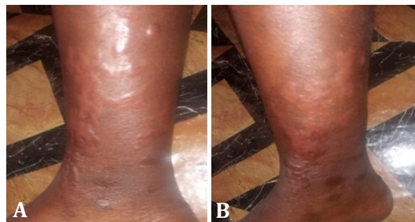
Fig 1. Lesiones eritematosas en el miembro inferior derecho