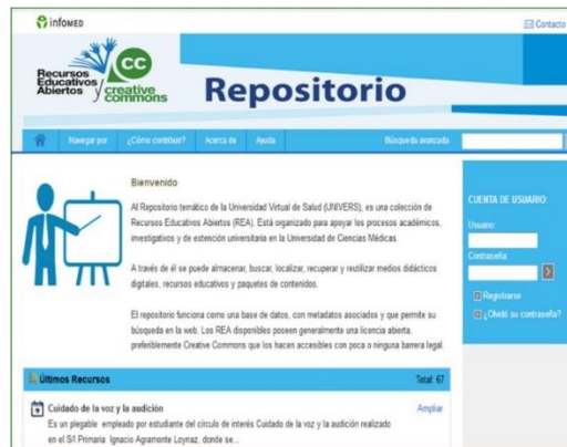
Fig. 2. Interfaz principal

En esta interfaz, el usuario tiene acceso a la barra de menú (fig. 3), la cual está conformada por las secciones 'Home', 'Navegar por', '¿Cómo contribuir?', 'Acerca de', 'Ayuda' y la sección de búsqueda avanzada. Esta última muestra a los usuarios un buscador que permite recuperar la información almacenada mediante palabras o frases contenidas en los metadatos e incluso en el cuerpo de los REA ("búsquedas de texto completo").