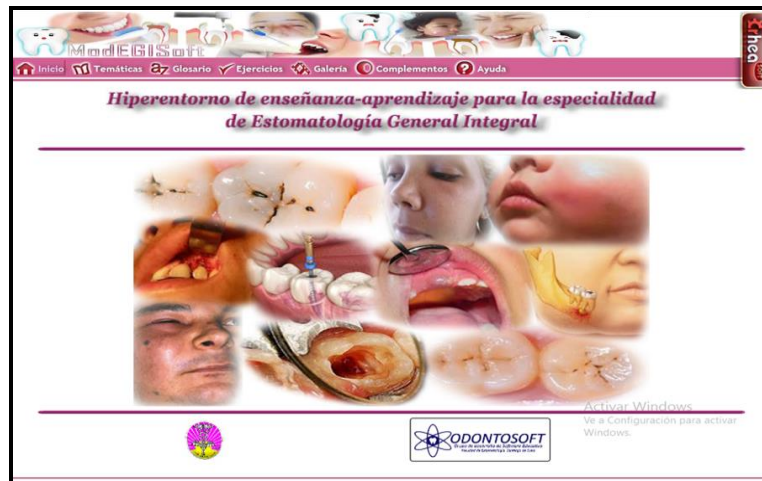
Fig. 1. Módulo Inicio o Página principal

Si se accede al módulo Temáticas se visualiza el índice de contenidos a través de un submenú desplegable, estructurado por 5 temas principales y 63 subtemas o sumarios secundarios, donde se abordan contenidos como: caries dental, celulitis y dolor facial, quistes maxilares, técnicas actuales de recubrimiento pulpares y pulpotomías, entre otros. También contiene imágenes insertadas y palabras calientes.