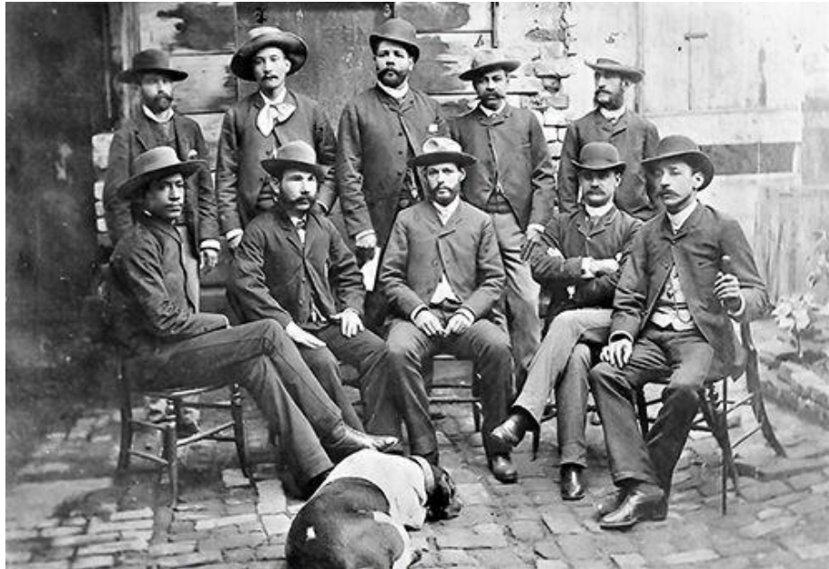
Fig. 2. Antonio Maceo en Costa Rica (1892), ubicado de pie en el centro

Conocido en la historiografía como «Contrato Lizano-Maceo» se elaboró un documento que aprobaba la creación de una colonia agrícola en la zona incomunicada de la península de Nicoya, provincia de Guanacaste en el litoral pacífico, con el apoyo de las cien familias cubanas que se contemplaba instalar en ella, empresa que en su inicio, dada su envergadura, sería financiada por el gobierno. (8) La colonia estaba destinada a la producción de tabaco, caña de azúcar y otros productos. Esta representaba, también, una oportunidad para dar estabilidad económico-financiera a un grupo de familias cubanas cuyas cabezas eran mambises que, de paso, estarían preparados para una invasión a Cuba.