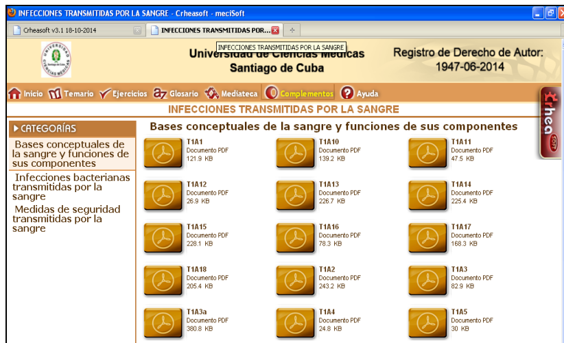
Fig. 4. Módulo Complemento

El módulo Complemento contiene toda la bibliografía y los materiales complementarios, algunos en forma de documentos y otros en Power point, distribuidos por temas que se identifican con íconos representativos de cada material, y al pasar el puntero del mouse por encima de ellos se mostrará su título, con la posibilidad de poder descargarlos en el momento que se desee. Este módulo brinda la posibilidad de ampliar y profundizar en los contenidos tratados (figura 4).