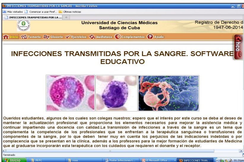
Fig. 1. Módulo Inicio

En el módulo Inicio se da la bienvenida a los estudiantes y se explica la estructura y los objetivos del curso, basando la motivación en la necesidad de elevar la calidad de la docencia y asistencia médica en relación con la práctica de una hemoterapia segura (figura 1).