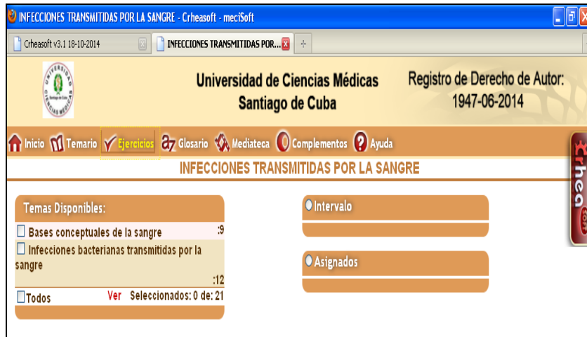
Fig. 3. Módulo Ejercicios

El módulo Complemento contiene toda la bibliografía y los materiales complementarios, algunos en forma de documentos y otros en Power point, distribuidos por temas que se identifican con íconos representativos de cada material, y al pasar el puntero del mouse por encima de ellos se mostrará su título, con la posibilidad de poder descargarlos en el momento que se desee. Este módulo brinda la posibilidad de ampliar y profundizar en los contenidos tratados (figura 4).