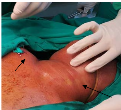
Fig. 1. Edema del cuello y la región anterosuperior derecha del tórax